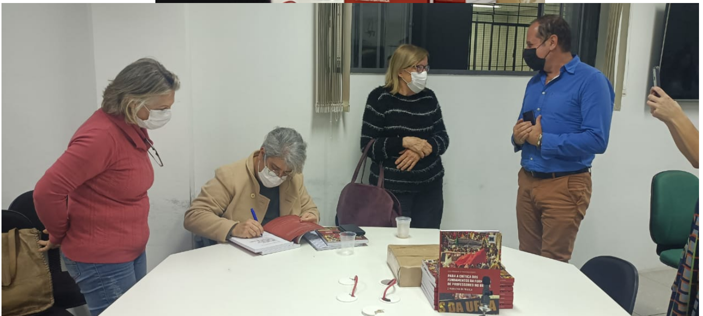
(03) 05.08.2022 – Visita e entrega de exemplares à Livraria Vertov que divulga os livros pela Estante Virtual e leva os livros a Feiras Universitárias